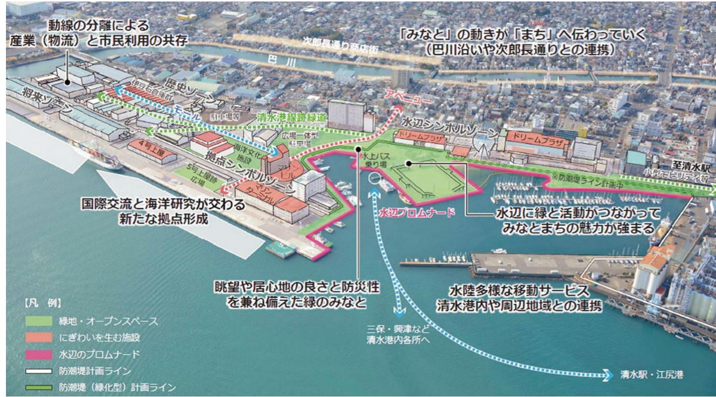
▲ 日の出地区等の将来イメージ(一社清水みなとまちづくり公民連携協議会「日の出・巴川河口地区ガイドプラン」(2023年2月)より)

清水港及び周辺では公共と民間が連携して港湾の魅力から地域の活力を高める「みなとまちづくり」が進んでいます。清水みなとまちづくり公民連携協議会は2019年に策定した清水港及び周辺の将来像『清水みなとまちづくりグランドデザイン』に基づいて活動、先導的な地区の実行計画の策定や諸課題を洗い出しシンポジウムなどで地域の皆様に情報公開しながら取り組んでいます。日の出地区では2023年11月エスパルスドリームプラザ新館(PARK-side)の新築に合わせて静岡県と商業事業者が連携して新しい防潮堤ができました。これは海側の緩傾斜緑地がデッキでドリームプラザ新館2階とつながって、文字通り公民連携が形になったもので、全国的にも珍しい取り組みです。