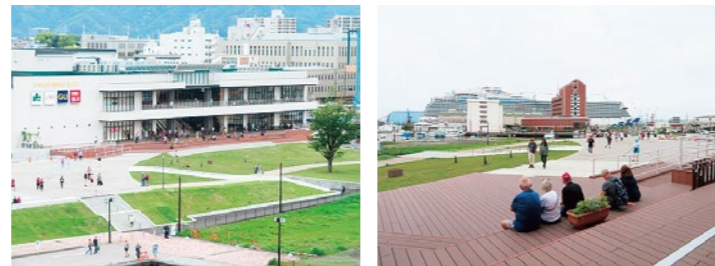
▲ エスパルスドリームプラザ新館(PARK-side)と緩傾斜緑地の全景

清水港及び周辺では公共と民間が連携して港湾の魅力から地域の活力を高める「みなとまちづくり」が進んでいます。清水みなとまちづくり公民連携協議会は2019年に策定した清水港及び周辺の将来像『清水みなとまちづくりグランドデザイン』に基づいて活動、先導的な地区の実行計画の策定や諸課題を洗い出しシンポジウムなどで地域の皆様に情報公開しながら取り組んでいます。日の出地区では2023年11月エスパルスドリームプラザ新館(PARK-side)の新築に合わせて静岡県と商業事業者が連携して新しい防潮堤ができました。これは海側の緩傾斜緑地がデッキでドリームプラザ新館2階とつながって、文字通り公民連携が形になったもので、全国的にも珍しい取り組みです。