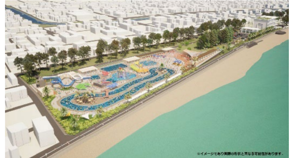
※イメージであり実際の形状と異なる可能性があります。

後は、夏季のプールだけでなく、公園施設、民間収益施設の設置により、1年を通じて楽しめる公園として期待されています。