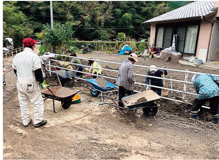
▲重機が入れない側溝などは人の手で土砂をかき出します。