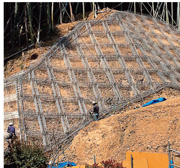
▲谷津山南麓の防災工事の状況