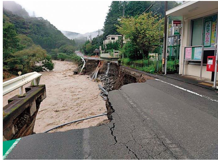
▲清沢生涯学習交流館の前の道路が崩落しました。

難しく、近隣住民と消防団、そして清沢地区内の有志が集まって行いました。地区内には重機を扱える住民もいたため、近隣住民の重機を借り、多くの住民の協力によって土砂を撤去しました。住民による初動ののち、建設会社やボランティアによる復興が行われました。