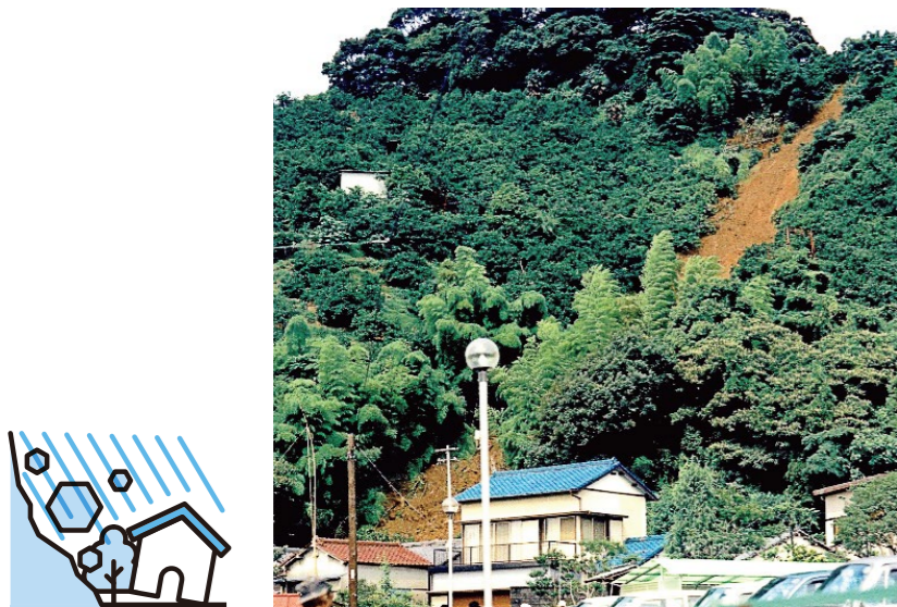
▲49年7月 谷津山の土砂災害

谷津山の南麓では七夕豪雨の際、山が崩れ二人が亡くなりました。その現場周辺では10年ほど前から防災工事が進められ、右下図のように整備されてきました。